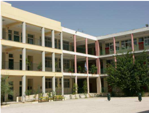
Le collège de Néa Smyrni...

Ce projet aboutit donc un déplacement des élèves français à Athènes du 14 au 27 février 2007 et des élèves grecs à la Garde du 20 mars au 2 avril 2007.