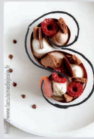
Dessert de Restaurant