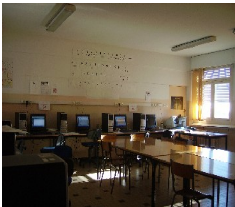
Notre classe informatique