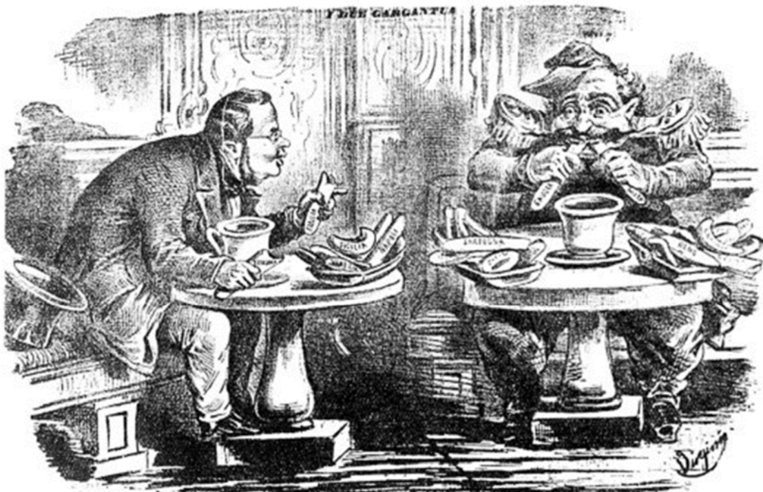
Doc. 3 : Caricature du journal satirique Il Fischietto. Les Deux Gargantua.

Cavour dévore la Toscane et l'Emilie et dispose dans son assiette de la Sicile, Naples et Venise pendant que Napoléon III avale Nice et la Savoie et attend d'avalier la rive gauche du Rhin et la Sardaigne.