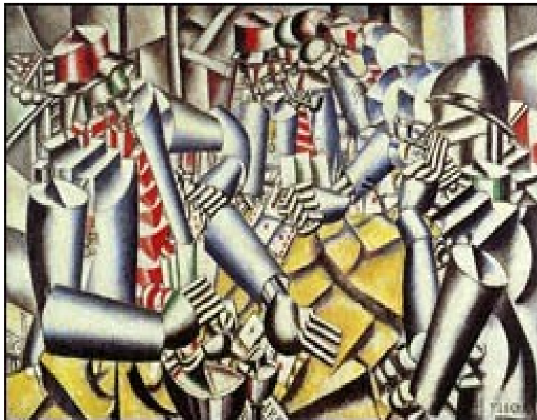
La partie de cartes, Léger, 1917.

Exploitation : dans l'étude du bilan de la guerre, étude comparée des oeuvres de guerre de Léger, notamment “La partie de cartes” (huile sur toile, 1917) accompagnées de la lecture d'extraits de ses lettres à Louis Poughon qui éclairent sur son exploitation artistique de la guerre et d'oeuvres d'Otto Dix, notamment “Les joueurs de Skat” (1920). L'objectif ici est de montrer une approche différente des horreurs de la guerre,