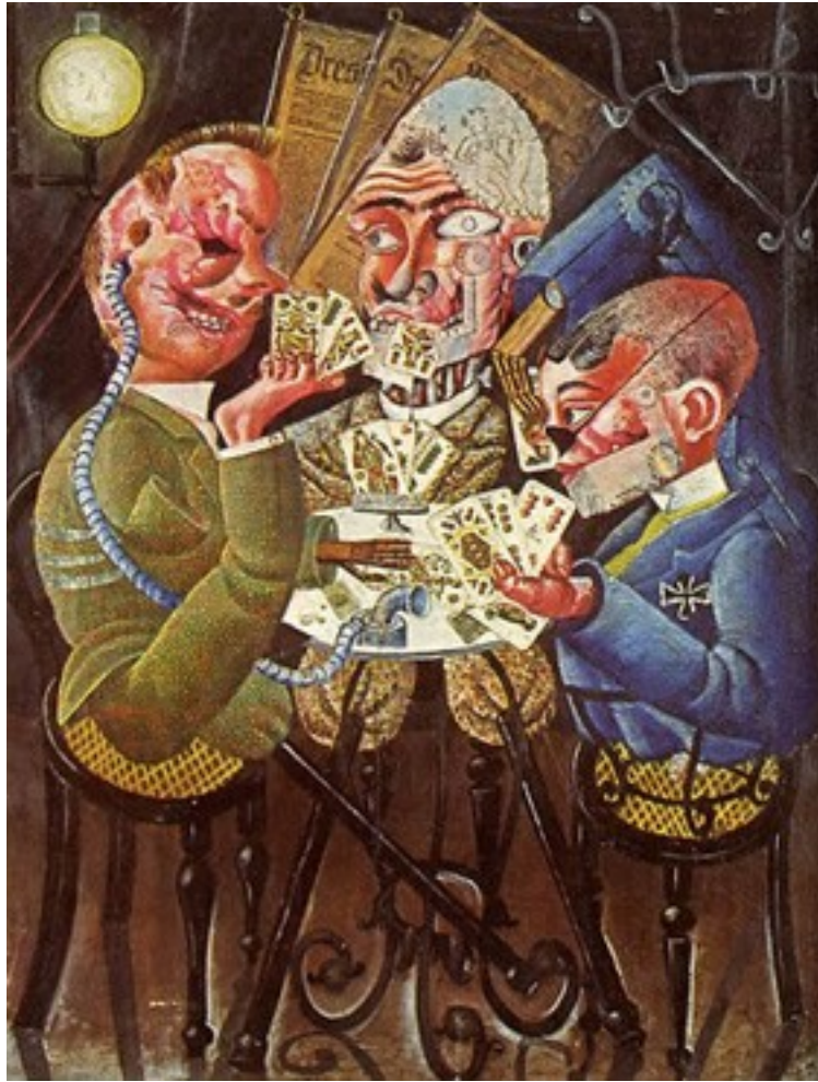
Les joueurs de skat, Otto Dix, 1920.