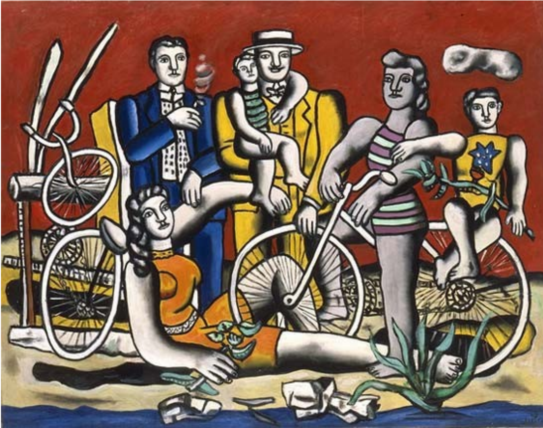
Loisir sur fond rouge, Léger, 1949.

Exploitation n°2 : A ces peintures murales, on raccroche l'étude de "Loisir sur fond rouge" (1949), témoignage d'un monde meilleur hérité du Front Populaire, ainsi que celle des "Constructeurs" (1950) pour la reconstruction de la France, la croissance économique et le modèle américain (prépondérance mondiale des Etats-Unis).