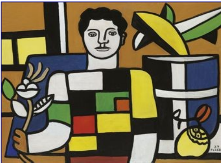
L'homme au chandail, Léger, 1937

Exploitation : Le 14 juillet 1935, Léger écrivait dans le Journal “Le Monde” : “Ce 14 juillet restera une date marquante dans les changements sociaux et nationaux de la France... Nous sortons d'une période sombre et confuse”. Cette citation amène à la problématique de la séquence sur la France des années 30 : “Comment la naissance du Front Populaire a-t-elle sauvé la démocratie en France?”, avec dans un premier temps, l'étude de “la période sombre et confuse”, puis des “changements sociaux et nationaux”, appuyés par l'étude de “L'homme au chandail”, personnage affirmé et vigoureux participant aux nouvelles réalités. Celles-ci mènent ensuite à l'étude des mesures du Front Populaire.