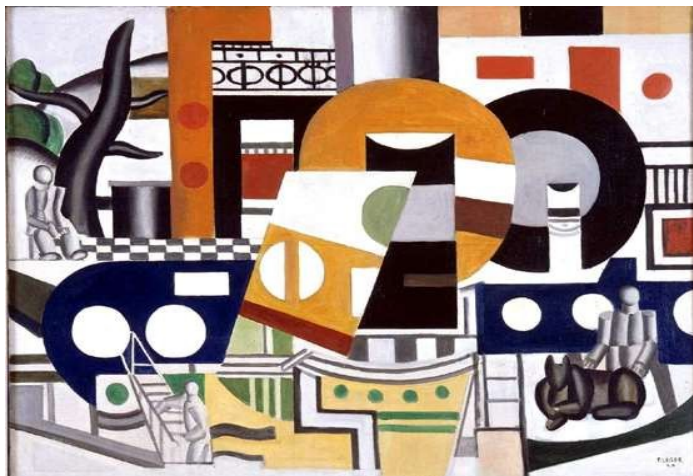
Le remorqueur, Léger, 1920.

D’après vous, qu’est-ce qui ne plaisait pas aux camarades artistes de Léger dans son approche du réalisme?